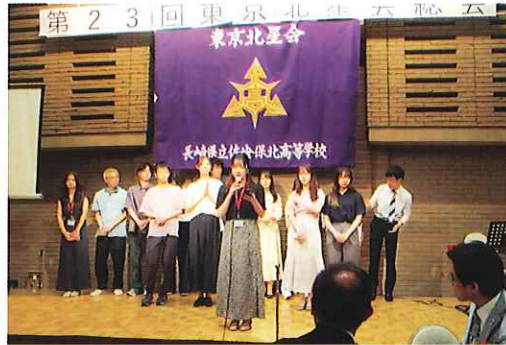
・第23回総会 新入生会員紹介